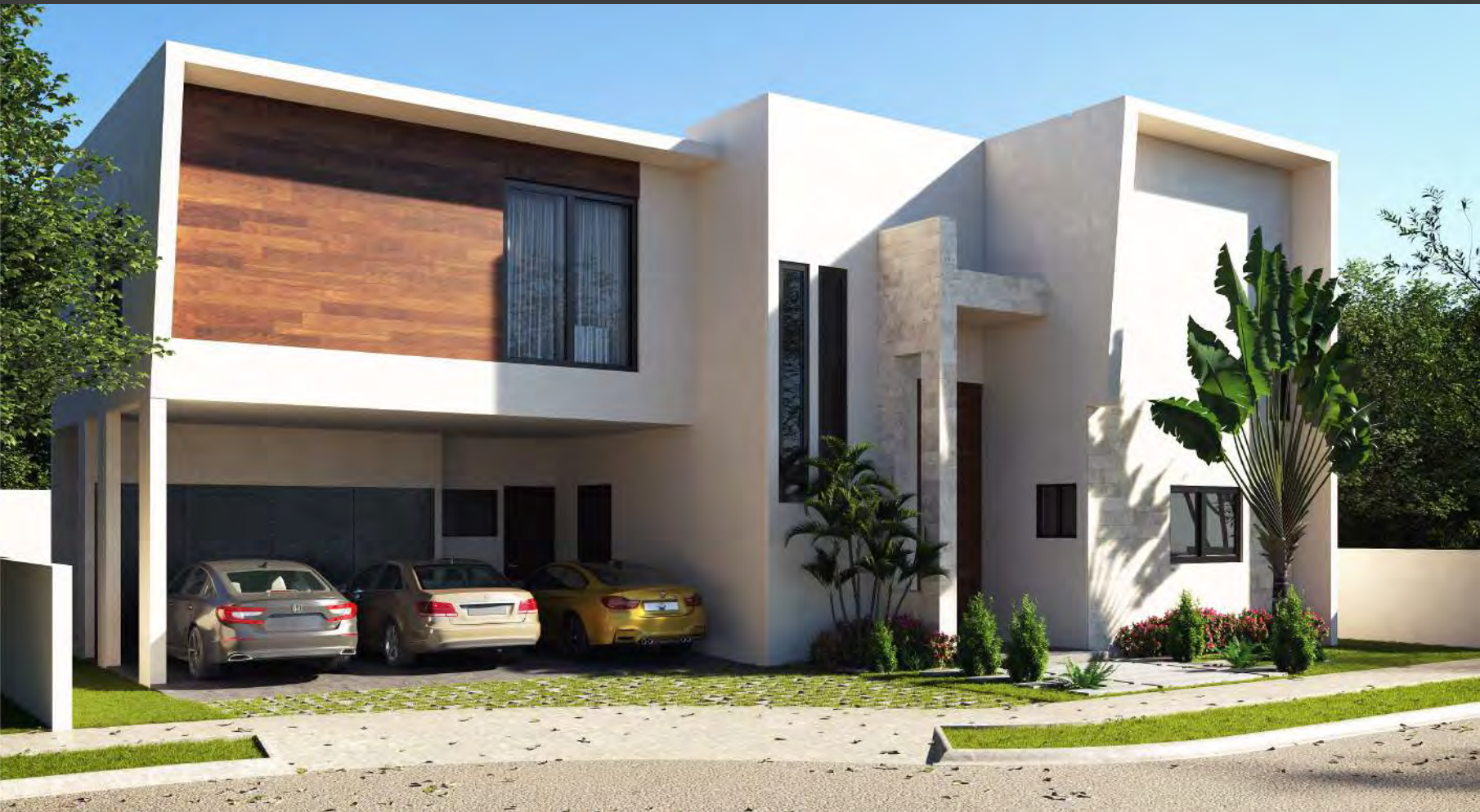
Casa Kutz 8